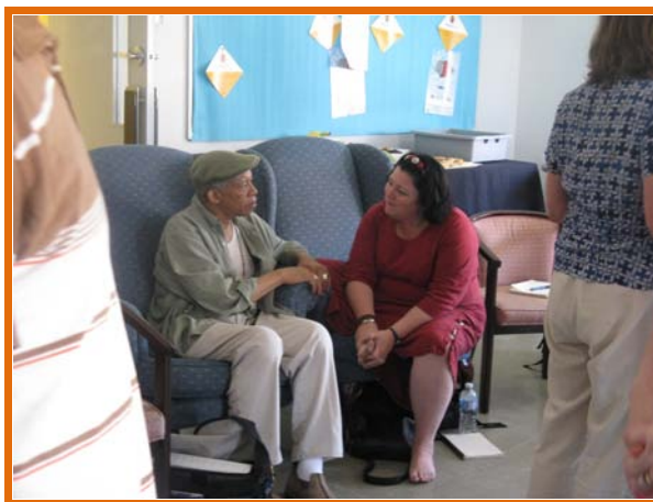
Un momento di scambio durante un Transition Training.

Ad Epitteto (55 -135 AD), schiavo e filosofo stoico romano (ma nato in Grecia), si attribuisce la famosa frase: “Ci sono date due orecchie, ma soltanto una bocca, per ascoltare il doppio e parlare la metà”. Ascoltiamo per capire e per imparare. Che senso ha insegnare a qualcuno come rammendarsi i vestiti se non siamo capaci di ascoltare questa persona abbastanza a lungo da capire che preferirebbe di gran lunga imparare ad aggiustarsi la bicicletta? Che senso ha aiutare qualcuno ad installare pannelli solari sul tetto se non lo abbiamo ascoltato abbastanza da capire che ciò di cui ha effettivamente bisogno è che il tetto venga riparato per evitare che entri la pioggia e si disperda il calore?