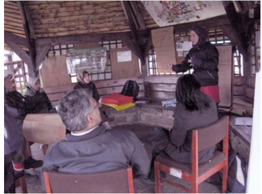
Durante un incontro di “Wisdom in Nature”.

A parte la nostra “Islamic Community Food Project” a Tower Hamlets in cui cerchiamo di integrare realtà associative presenti sul territorio, usiamo un esercizio che consiste nel lanciare al gruppo la seguente affermazione: “è egoista da parte della classe media pensare al cibo che mangia, mentre milioni di persone stanno morendo di fame”. Ai partecipanti viene quindi chiesto di posizionarsi nella stanza in base a quanto ritengono che questa affermazione sia vera. In seguito si ascoltano le differenti opinioni e i partecipanti sono liberi di muoversi se la loro opinione dovesse cambiare. Devo confessare che anche se siamo entusiasti di coinvolgere in WIN più persone provenienti retroterra meno privilegiati, non abbiamo avuto così tanto successo come avremmo sperato. In ogni caso in piccolo sperimentiamo alcuni frutti del nostro lavoro nell’ambito dei ranghi e dei privilegi.