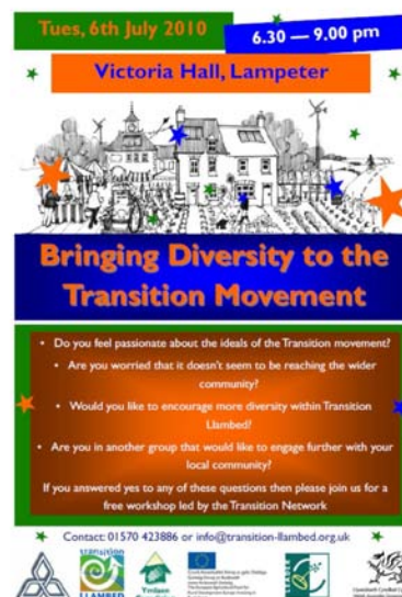
Transition Llambed (Lampeter) ha creato due poster per lo stesso evento, in Inglese e in Gallese