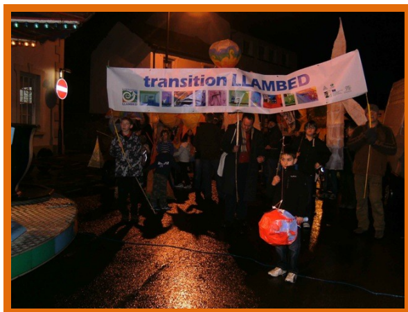
La parata delle lanterne di Transition Llambed.

abitazioni inadeguate e alla difficoltà di trovare lavoro nella Londra degli anni '50, la comunità