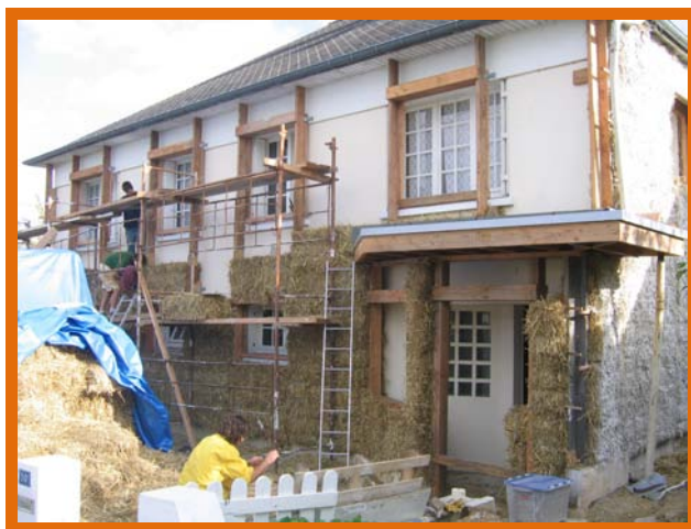
Una casa in Francia viene isolata con balle di paglia. L'applicazione di queste tecniche potrebbe creare nuovi posti di lavoro, capacità, imprese locali.

Un metodo per radicare l'inclusività e la giustizia sociale nella vostra iniziativa è cominciare a pensare come potrebbero essere fatti i vostri progetti di Transizione se lavorate su inclusività e giustizia sociale, e come sarebbero se non lo fate . Un punto di partenza per cominciare a capire come muoversi per far sì di radicare questi valori in ogni attività.