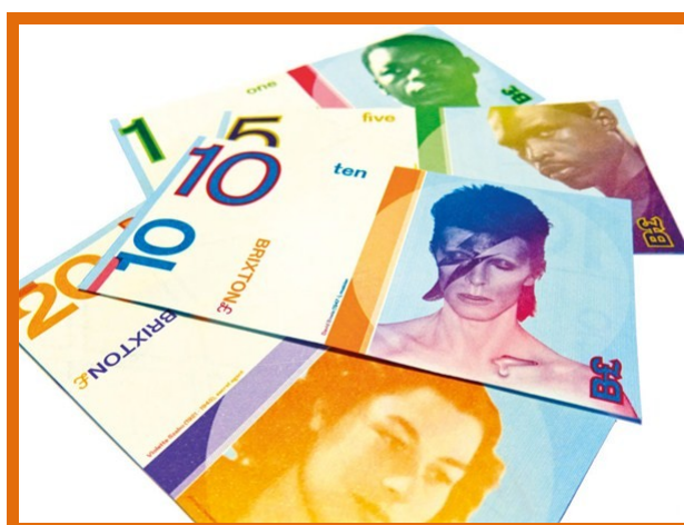
La ristampa del 2011 della sterlina di Brixton, una moneta complementare utilizzata nel Sud di Londra, decorata con personaggi culturali e storici della zona.