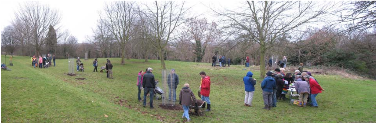
Creando un frutteto condiviso a Brockley Park, Londra.