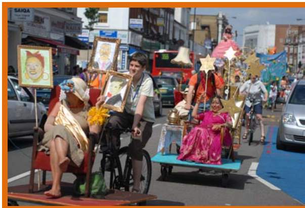
I giovani pedalano e gli anziani si godono la vista delle strade di Tooting addobbate per il Trashcatchers Carnival, estate 2010.

Molte feste sono nate dalla celebrazione della libertà e delle differenze, specialmente in tempi di ineguaglianza e ingiustizia. Per esempio, il Carnevale inglese di Notting Hill è nato a Trinidad, con la prima festa di Carnevale, nel 1833, per celebrare la fine della schiavitù nei Caraibi. Come risposta alle tensioni razziali, alle